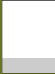
PIE DE PÁGINA AL CORTE 23.00 x 6.50 cm

Los avisos deben entregarse en los siguientes formatos: